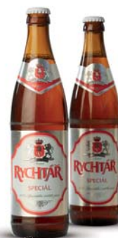
Rychtář Speciál Pivovar Rychtář, a.s.