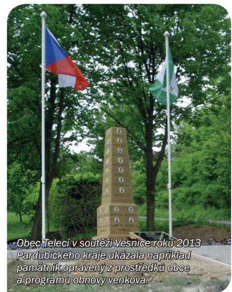
Obec Teletice v soutěži Vesnice roku 2013 Pardubického kraje ukázala například památník opravený z prostředků obce a programu obnovy venkova.