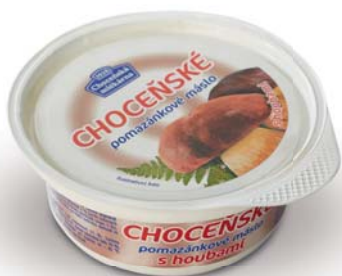
Choceňské pomazánkové máslo s houbami Choceňská mlékárna s.r.o.