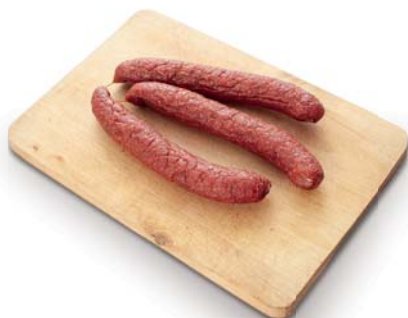
Pernštýnská klobása Uzeniny Kořínek s.r.o.