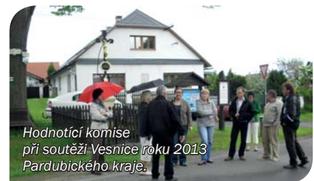
Hodnotící komise při soutěži Vesnice roku 2013 Pardubického kraje.

Možná vás to překvapí, ale je to úplně jednoduché. Stačí systém nastavit tak, aby ten, kdo třídí, byl zvýhodněn, a ne obráceně. Tedy jinými slovy, kdo třídí, by měl ušetřit. Naopak ten, kdo je pohodlný a netřídí, by měl zaplatit více. Každý z nás by měl platit za to, co nevytřídil a ne naopak.