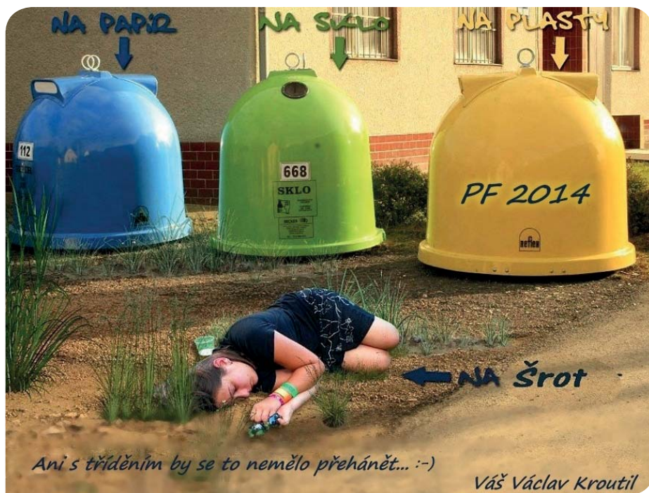
Ani s tříděním by se to nemělo přehánět... :-)