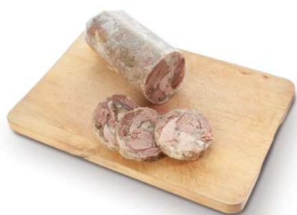
Tlačěnka speciál BOCUS, a.s. Letohrad