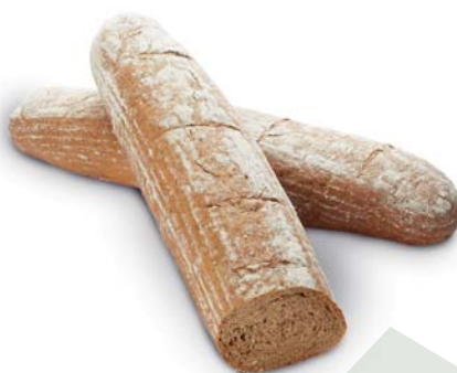
Královský chléb AGRO VYSOČINA BYSTRÉ a.s.