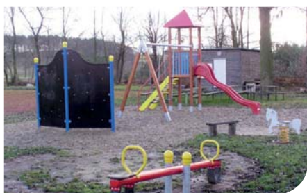
Dětské hřiště Radiměř fiche č. 5

Žadatel: Obec Vítějeves Celkové způsobilé výdaje: 311 369 Kč Přiznaná výše dotace: 236 105 Kč