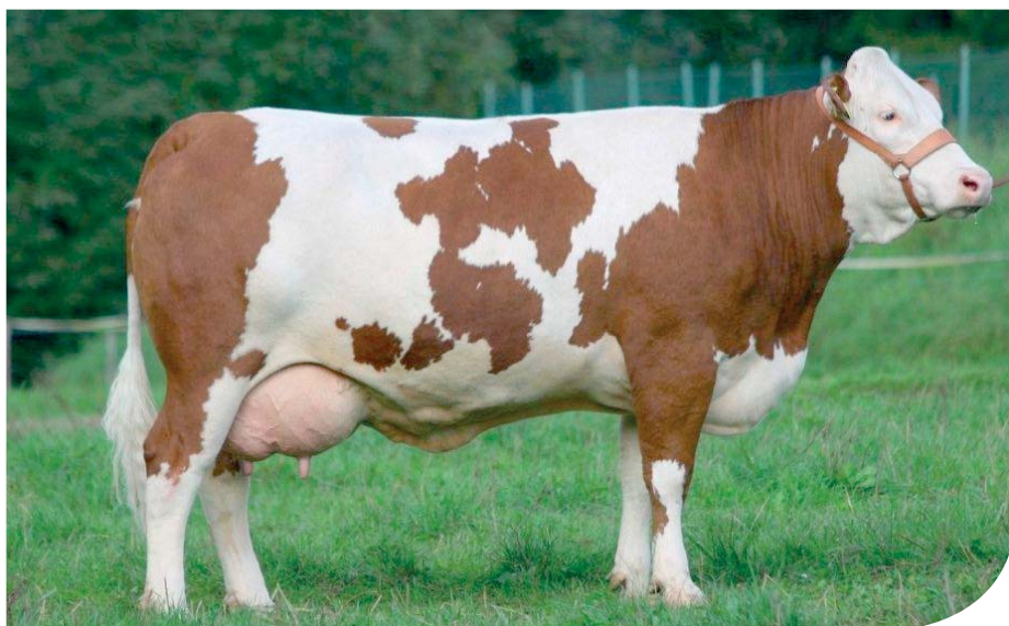
Šampionka ČR za rok 2010.