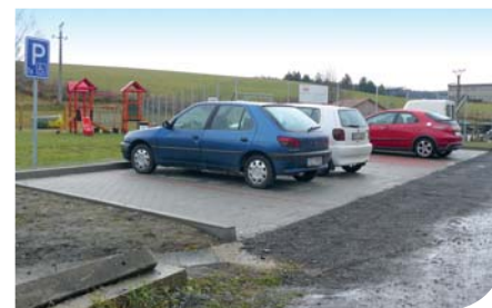
Výstavba parkovacích stání u sportovního hřiště v obci Vítějeves, fiche č. 4

Žadatel: Obec Vítějeves Celkové způsobilé výdaje: 852 850 Kč Přiznaná výše dotace: 642 336 Kč