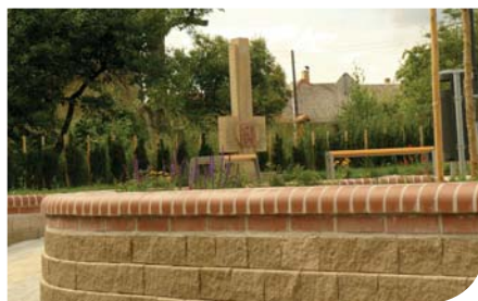
Úprava veřejného prostranství s přemístěním pomníku z II. světové války, fiche č. 4

Žadatel: Město Březová nad Svitavou Celkové způsobilé výdaje: 559 298 Kč Přiznaná výše dotace: 419 473 Kč