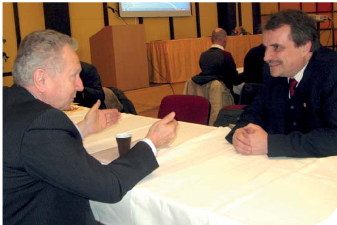
Jan Veleba, prezident Agrární komory České republiky hovoří s Václavem Kroutilem, radním Pardubického kraje pro zemědělství, o uzavřené sektorové dohodě.

Sektorové rady dostaly na začátku možnost poukázat na řešení konkrétního problému. Takových „deklarací“ bylo předloženo 24, z nichž bylo vybráno sedm