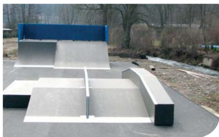
Skatepark Březová nad Svitavou, fiche č. 5

Žadatel: Město Březová nad Svitavou Celkové způsobilé výdaje: 559 298 Kč Přiznaná výše dotace: 419 473 Kč