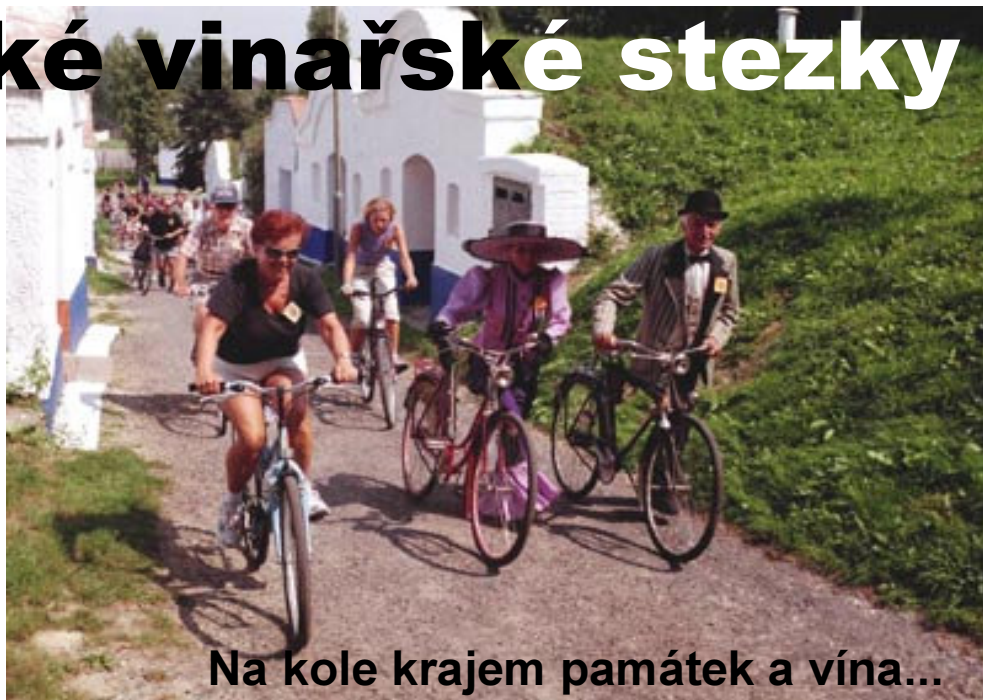
Na kole krajem památek a vína...

Od kamenných hradeb královského města Znojma až do slovácké metropole Uherského Hradiště vás napříč všemi vinařskými podoblastmi